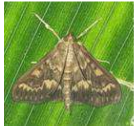
Adulto maschio di Piralide

La fase iniziale di volo-inizio ovideposizione è il momento ottimale anche per effettuare i trattamenti con prodotti di origine biologica, Trichogramma maidis e Bacillus thuringiensis ; quest'ultimo va impiegato due volte, a distanza di circa 10 giorni fra un intervento e l'altro.