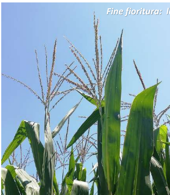
Fine fioritura: le antere si seccano e cadono