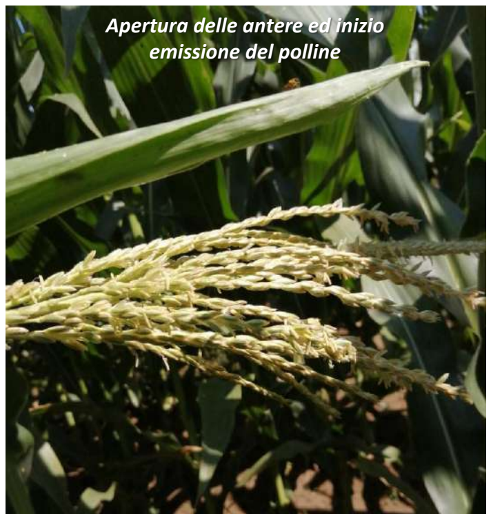
Apertura delle antere ed inizio emissione del polline