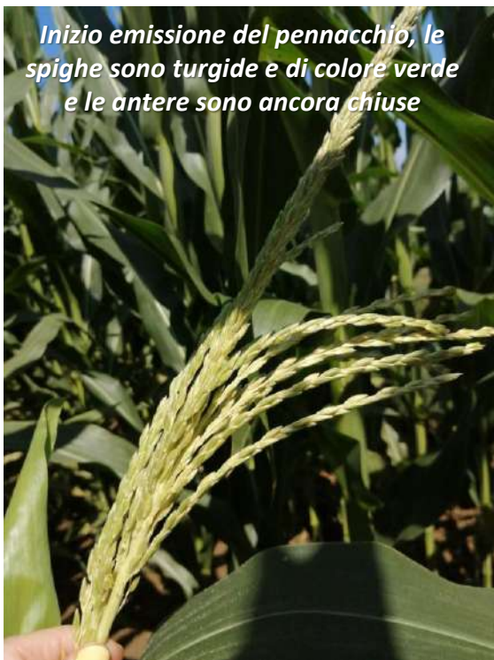
Inizio emissione del pennacchio, le spighe sono turgide e di colore verde e le antere sono ancora chiuse

Secondo la scala fisiologica ufficiale BBCH la fase di fioritura del mais si colloca fra BBCH 61 (inizio emissione infiorescenza maschile o «pennacchio») e BBCH 69 (sete completamente imbrunite). L'infiorescenza maschile inizia ad emettere il polline circa due giorni dopo l'emissione dello stelo centrale del pennacchio e continua a produrlo per circa 10-14 giorni. Tuttavia la fase di maggior produzione del polline si colloca nei 3-8 giorni successivi all'emissione del pennacchio. Per verificare la fine della produzione di polline è sufficiente scuotere una pianta e verificare se dal pennacchio scende ancora il polline ossia la fine «polverina gialla». Inoltre, una volta che l'infiorescenza maschile smette di produrre il polline, le antere che lo contenevano imbruniscono, disseccano e si staccano dal pennacchio.