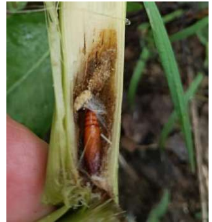
Crisalide nello stocco

Il momento ottimale per effettuare un intervento va dall'inizio delle ovideposizioni alla schiusura delle uova; nella prima fase di ovideposizione è consigliato l'impiego di principi attivi ad azione ovidica e ovaricida (Clorantropolo*, Tebufenozide*) mentre successivamente è possibile intervenire con principi attivi diversi e che hanno un'azione abbattente e di contatto principalmente sulle larve neonate (Deltametrina, Lambdaialotrina, Etofenprox; prestare attenzione al tempo di carenza di quest'ultimo). Nel caso di presenza elevata di Diabrotica, in questa prima fase di ovideposizione, si consiglia l'impiego del doppio principio attivo.