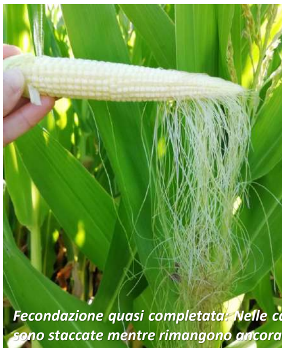
Fecondazione quasi completata: Nelle cariossidi fecondate correttamente le sete si sono staccate mentre rimangono ancora attaccate sui semi non ancora fecondati