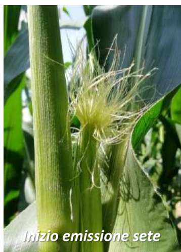
Inizio emissione sete

Ogni cariosside della spiga porta una seta inizialmente di colore verde chiaro; una volta che la seta è stata fecondata imbrunisce, quindi dissecca e poi cade. Quindi, per verificare lo stato di avanzamento o la corretta fecondazione, è sufficiente togliere delicatamente le brattee dalla spiga e scuotere la spiga per vedere se le sete cadono. Se la seta cade significa che l'ovulo è stato fecondato ed è già ben visibile la cariosside.