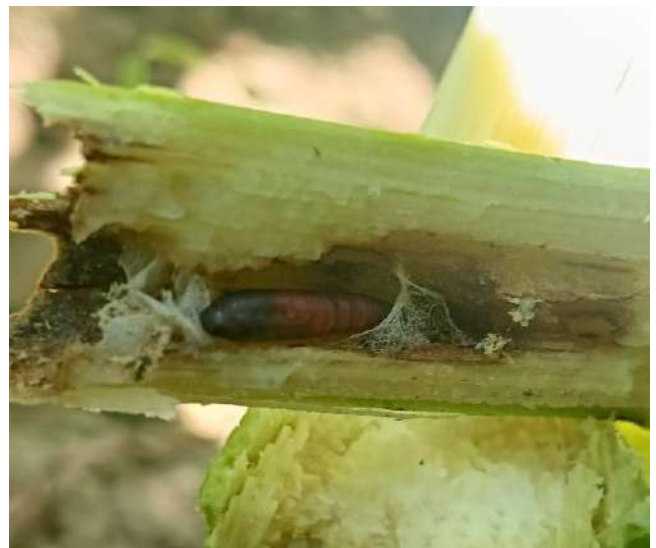
Larva matura (a sinistra) e crisalide (a destra) nello stocco