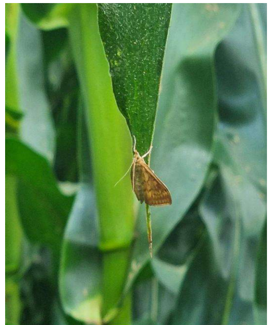
Crisalide all'ascella fogliare (a sinistra) e adulto maschio di Piralide (a destra)