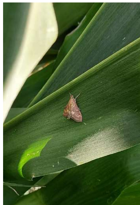
Adulto maschio di Piralide

Vista l'elevata disformità è importante verificare bene la situazione nei propri appezzamenti prima di pianificare eventuali interventi di controllo.