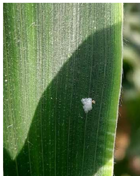
Ovatura fresca di Piralide