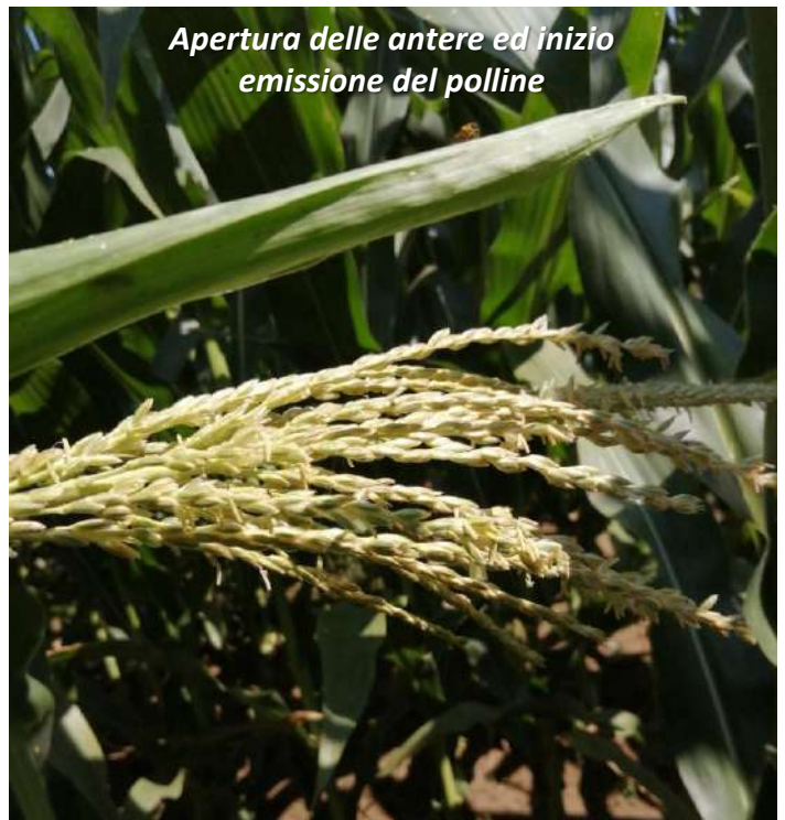
Apertura delle antere ed inizio emissione del polline