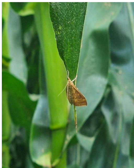
Crisalide all'ascella fogliare (a sinistra) e adulto maschio di Piralide (a destra)