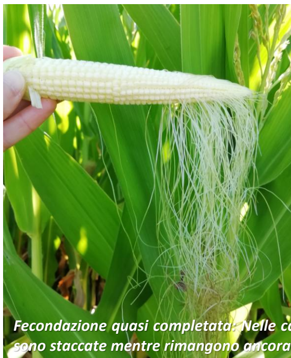
Fecondazione quasi completata. Nelle cariossidi fecondate correttamente le sete si sono staccate mentre rimangono ancora attaccate sui semi non ancora fecondati