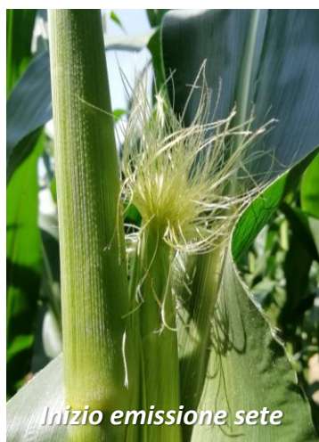
Inizio emissione sete

Ogni cariosside della spiga porta una seta inizialmente di colore verde chiaro; una volta che la seta è stata fecondata imbrunisce, quindi dissecca e poi cade. Quindi, per verificare lo stato di avanzamento o la corretta fecondazione, è sufficiente togliere delicatamente le brattee dalla spiga e scuotere la spiga per vedere se le sete cadono. Se la seta cade significa che l'ovulo è stato fecondato ed è già ben visibile la cariosside.