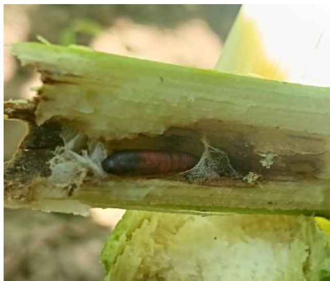
Larva matura (a sinistra) e crisalide (a destra) nello stocco