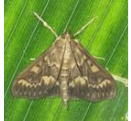
Adulto maschio di Piralide

Vista l'elevata disformità è importante verificare bene la situazione nei propri appezzamenti prima di pianificare eventuali interventi di controllo.