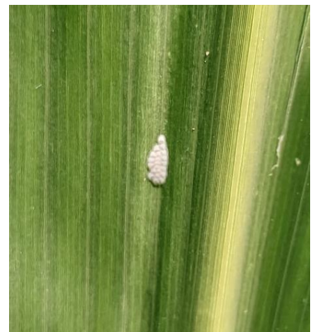
Ovatura fresca di Piralide